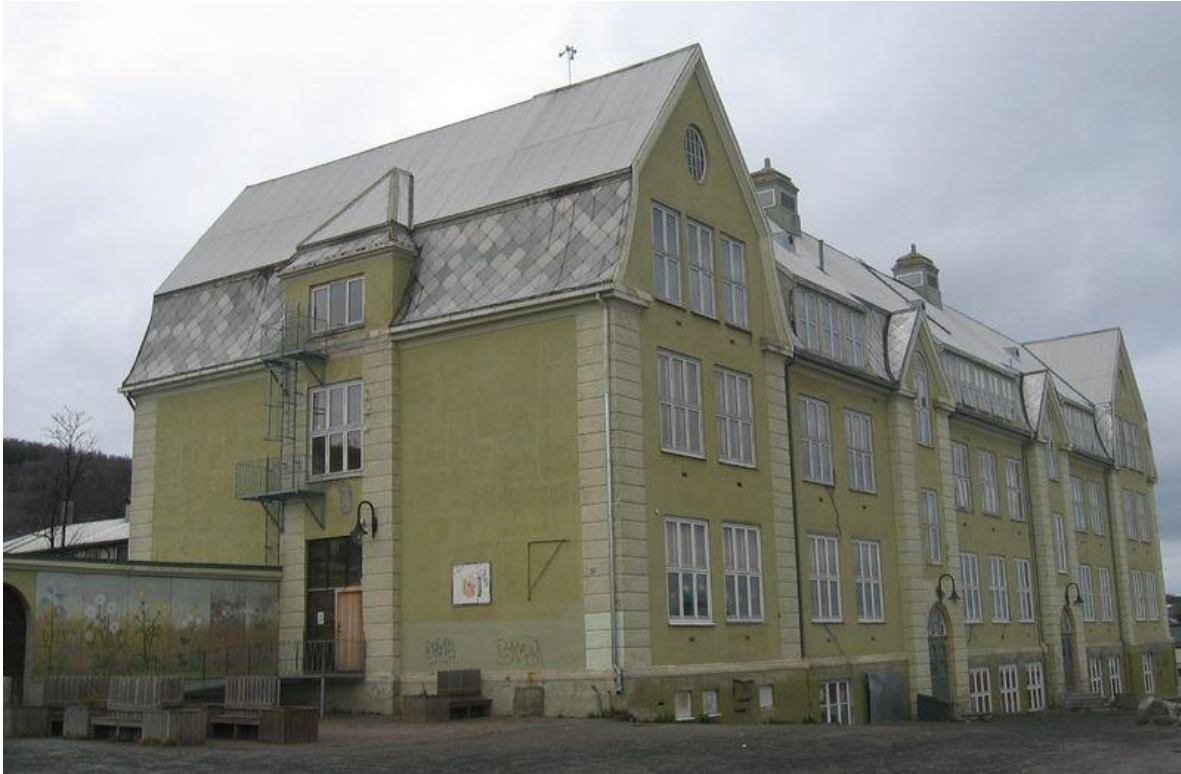
Byskolen bygd i 1918. Et praktbygg reist i krigstida.

utgjort et betydelig økonomisk løft for Harstad kommune. Harstad fulgte byloven for barneskole, dvs. de hadde undervisning hver dag. Landkommunene hadde undervisning bare tre dager i uka, derfor var det mange fra nabokommunene som ønsket å sende sine barn til Byskolen. Den ble bygd for flere elever enn det var barn i byen.